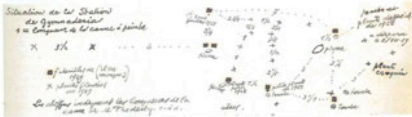
Localisation des Gymnadenia albida le 3 juillet 1929.

Mercredi 3 [juillet 1929]. Planté des fiches en bois à section circulaire à 10 cm. ds la direction du bois à chacune des 16 Gymnadenia + 2 Gymn. près de Périgny. Une des Gymnadenia manque à l'appel.