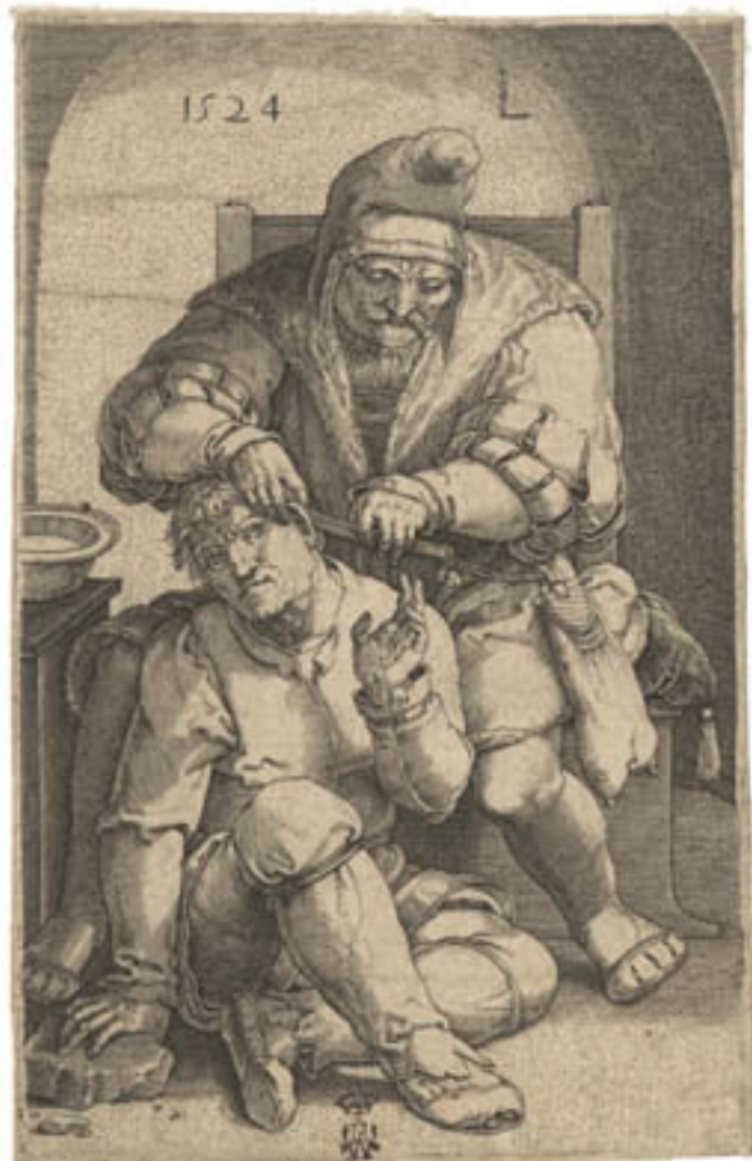
Philippus Galle, Planche d'anatomie-

docteur Tulp de Rembrandt, dont l'exposition propose une copie, en est le plus célèbre exemple. Au XIX e siècle, le fossé entre art et science se creuse et la représentation du corps se fait de plus en plus objective. L'invention de la photographie a rendu obsolètes ces représentations anatomiques. Mais les liens entre art et médecine n'ont jamais cessé.