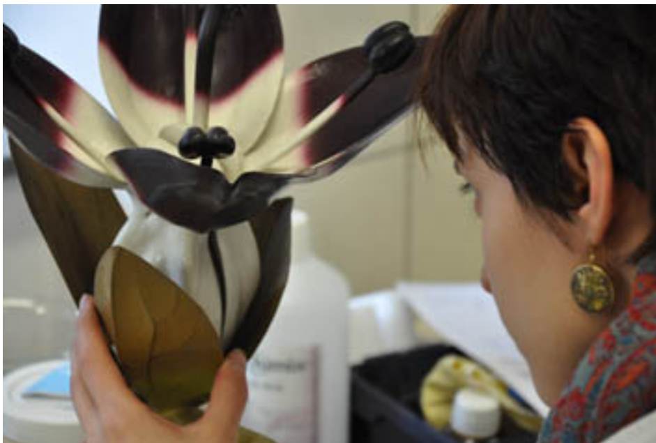
Conditionnement des collections zoologiques de l'Aquarium-Muséum de Liège -- Restauration des modèles de Brendel (Botanique)

Cette rétrospective espère guider le visiteur de bizarrerie en bizarrerie et lui faire traverser le temps grâce à des objets qui racontent leur propre histoire, souvent avec un regard anecdotique, voire décalé. Du poil de mammoth à l'œil du cyclope , c'est un voyage dans le passé, depuis des centaines de millions d'années jusqu'à la fin du 20 e siècle. Avec ces 200 bizarreries scientifiques, l'Embarcadère du Savoir pense indéniablement vous étonner... Le titre répond, à lui seul, à cette volonté en évoquant les poils d'un animal aujourd'hui totalement disparu et l'existence réelle de ce que nous pensions être un mythe !